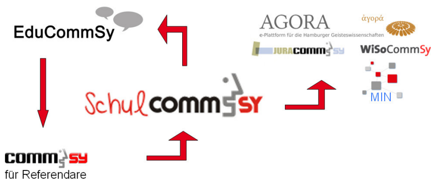
Abbildung: CommSy im Zyklus der Ausbildung (Hamburg)

Bundesministerium für Bildung und Forschung