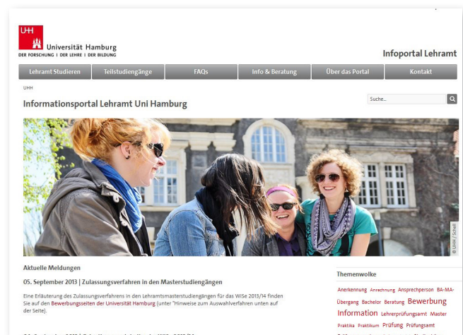
Screenshot des Portals

Wichtig für die Einführung des Blogs als sichtbare Adresse und Anlaufstelle für Fragen und qualifizierte Antworten rund um das Lehramtsstudium ist in der Anfangsphase die Einbeziehung der bestehenden informellen Kommunikation, z.B. in Facebook-Gruppen, damit die Studierenden das Infoportal und das Blog kennen lernen. So verweisen die Gruppen auf das Blog und verlinken dorthin. Fragen, die in den Facebook-Gruppen gestellt werden, werden im Blog aufgegriffen, dokumentiert, moderiert beantwortet und wieder zurückverlinkt. Dazu wird je nach Anfrage auf die Wissensbasis des Infoportals lehramt.uni-hamburg.de zugegriffen bzw. verlinkt. Idealerweise entwickelt sich das Blog zu einer Community für Lehramtsstudierende, zu einer digitalen „Heimat“, wo aktuelle Fragen und Probleme geklärt werden, von wo aber auch weiter verwiesen werden kann. Passend zum Semes-