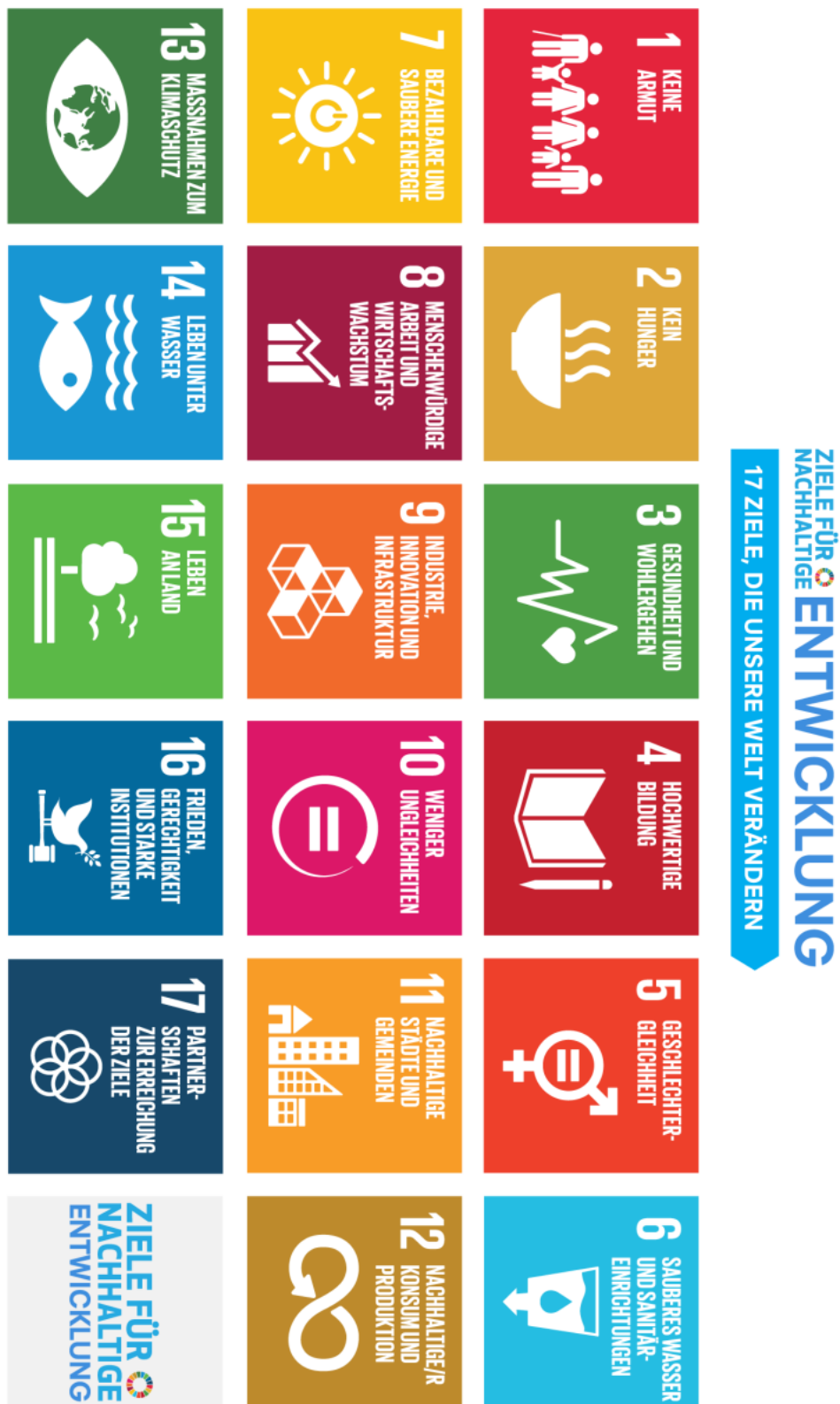
Abb. 1: Übersicht der Sustainable Development Goals (SDGs)

Developed in collaboration with TROLLBÄCK + COMPANY | Trin@trollbaeck.com | +1 212 529 1010 For queries on uspa, contact: q@campingdesign.org | Non-official translation made by UNIFIC Busside (September 2015)